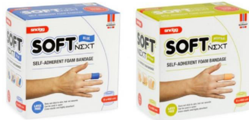
Επίδεσμος snogg soft (επαγγελματικός) 100cm x 4,5m